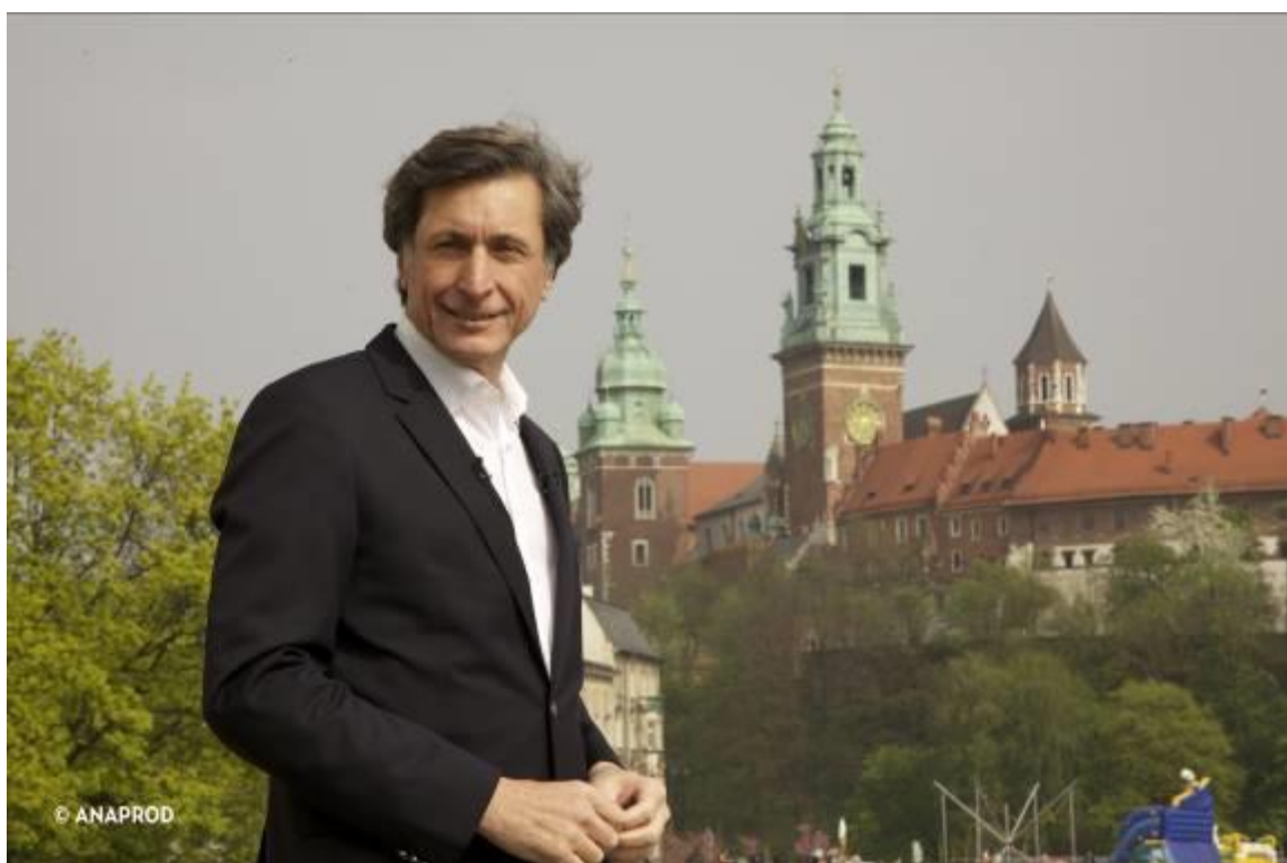
Chateau de Wawel à Cracovie